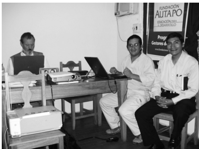
Iniciando la gestión del proyecto en la UAP.

El proyecto es aprobado por el Honorable Consejo Universitario y se convierte en una política de cualificación de la oferta formativa en las seis Áreas y doce programas correspondientes con apoyo de FAUTAPO bajo convenio y respaldo económico proveniente del IDH.